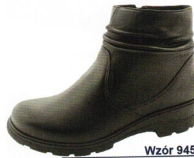
Wzór 9453 roz. 36-41 Kolor: Czarny, Tęgość H / H 1/2