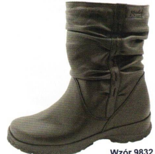
Wzór 9832 roz. 36-43 Kolor: Czarny, Tęgość H / H 1/2