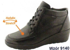
Wzór 9140 roz. 36-41 Kolor: Czarny+Stretch, Tęgość H / K