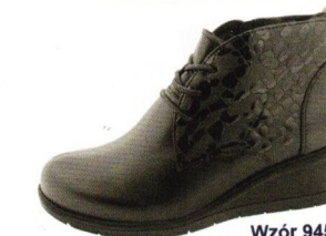
Wzór 9451 roz. 36-41 Kolor: Czarny+Babelki, Tęgość H / H 1/2