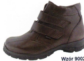
Wzór 9002 roz. 36-43 Kolor: Brąz, Tęgość H / K