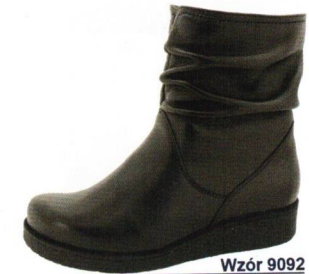
Wzór 9092 roz. 36-42 Kolor: Czarny, Tęgość H / H 1/2