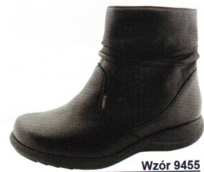
Wzór 9455 roz. 36-43 Kolor: Czarny, Tęgość H / H 1/2