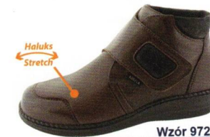
Wzór 9726 roz. 36-42 Kolor: Brąz+Stretch, Tęgość H / K