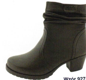
Wzór 9275 roz. 36-41 Kolor: Czarny, Tęgość H / H 1/2