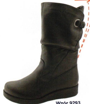
Wzór 9293 roz. 36-42 Kolor: Czarny, Tęgość H / H 1/2