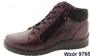
Wzór 9765 roz. 36-41 Kolor: Rubin+Pyton, Tęgość H / K