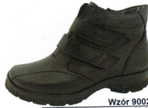
Wzór 9002 roz. 36-43 Kolor: Czarny, Tęgość H / K